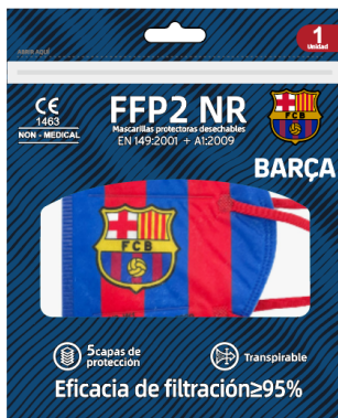
Bolsa individual termosellada