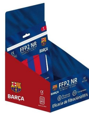
Caja display de 50 unidades