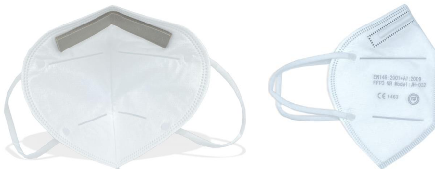
Mascarilla FFP3 NR